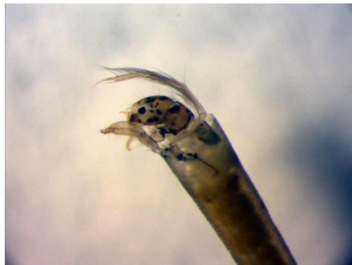
Fnyskbäcken (tv) och den ovanliga nattsländelarven Leptocerus tineiformis som påträffades i Follbrinkströmmen(th)