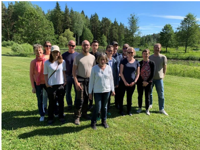
Styrelsen och arbetsgruppen vid Kolardammarna.